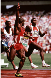
Ben Johnson alle Olimpiadi del 1988

Scarica e stampa la tua copia dal sito della scuola www.salvemini.sansebastianoalvesuvio.scuolaeservizi.it