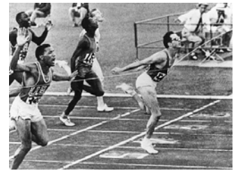
L. Berruti taglia il traguardo, olimpiadi 1960